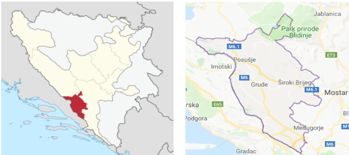
Slika 2.1.1: Županija Zapadnohercegovačka

Uslijed činjenice da se Županija Zapadnohercegovačka nalazi na prijelazu između Jadranskog primorja i visokih planina Bosne, klima je mediteranska s vrućim ljetima i umjerenim zimama u južnim predjelima, dok je u sjevernim izrazito kontinentalna s umjerenim ljetima i vrlo, štoviše i ekstremno hladnim zimama.