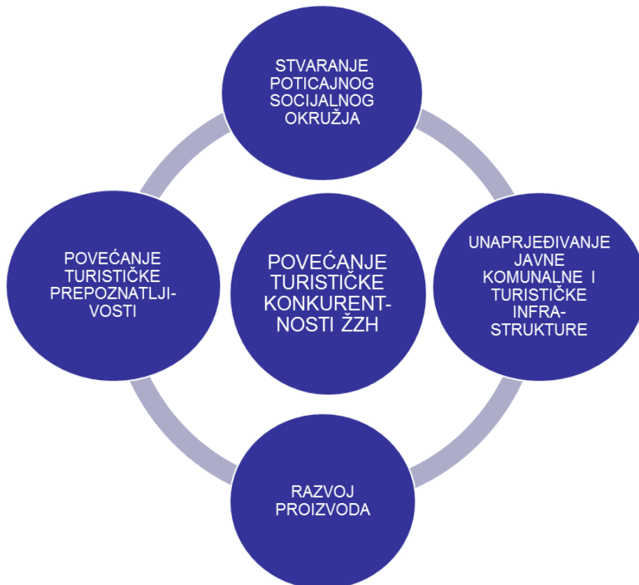
Slika 8.1: Područja podizanja konkurentnosti turizma Županije Zapadnohercegovačke