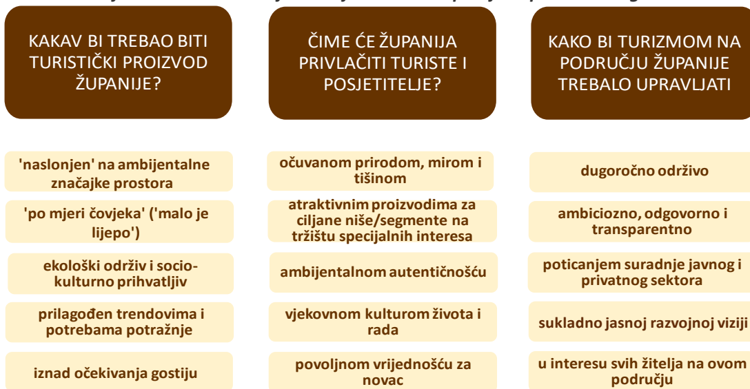
Slika 6.2.1: Ključne odrednice vizije razvoja turizma Županije Zapadnohercegovačke

Odgovori do kojih se došlo na radionici na kojoj su sudjelovati predstavnici različitih skupina razvojnih dionika sažeto su prezentirani na slici 6.2.1.